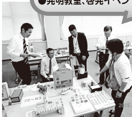
[鳥取県発明くふう展審査会の様子]