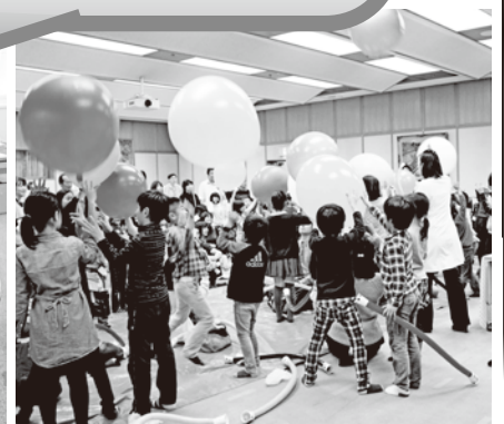
[啓発イベントの様子]