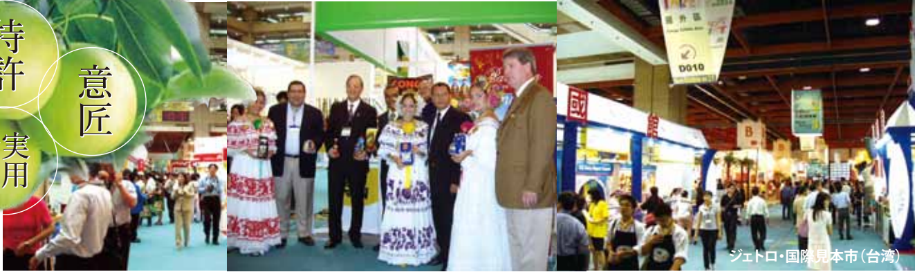
ジェットロ・国際見本市(台湾)