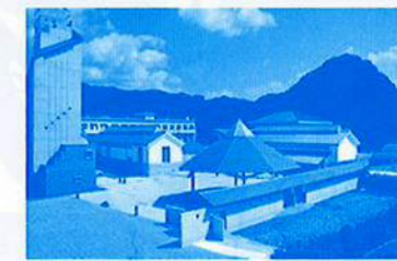
【展示会場】因幡万葉歴史館

【日時/会場】 平成28年11月13日(日) 鳥取市国府町コミュニティセンター(鳥取市国府町庁380)