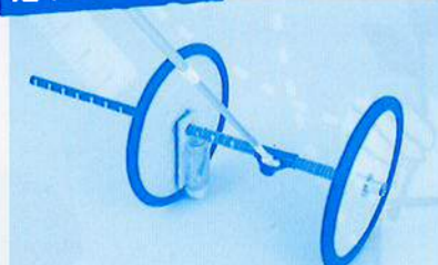
無針弧 compass (小学校2年)

ある日、母が飲み終わった紙のコーヒーカップをもらって工作することにし、もらった紙カップを転がしてみたところ、弧を描いて転がったのです。それを見て「まるでコンパスのようだ」、「この原理を利用してコンパスを作れないか?」と考えました。従来品は大きな円弧は描けず、針と鉛筆の間に障害物がある場合も描けません。本案は針無しで望む半径の円弧を描けます。紙カップやロールペーパー芯で実験を繰り返して得意の数学でも検算を重ねて試作し、半径10mの円を描き実測したところ、±20mmほどのズレの円を描けました。