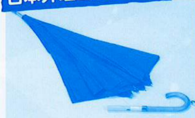
トットレール・アンブレラ (小学校6年)

この作品は、取っ手が取れることでたかさんの良いことがある傘です。「自転車のサドルを外しておくとうるさい」という話を聞き、傘も取っ手を取っておけば同じ効果があるのではないかと思い作り始めました。次に取り外した取っ手にカラビナを付けカバンにぶら下げておくことで、置き忘れ防止になること、更に取っ手を外し、逆さまにすることで傘が自立すること、取っ手を傘の先に付けることで干しやすくなることに気が付きました。