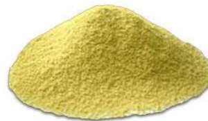
はっさくオイルエキス