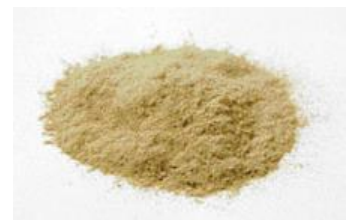
混合ハーブエキス