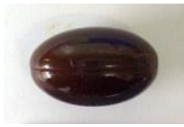
タブレットやサプリメント