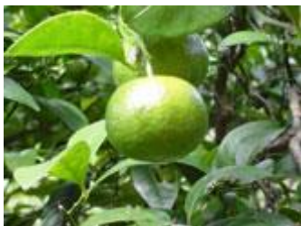
シイクワシャーの果実