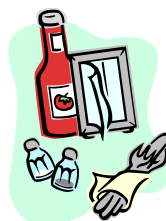
調味料、ドレッシング