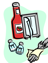
調味料、ドレッシング