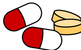
サプリメント、タブレット