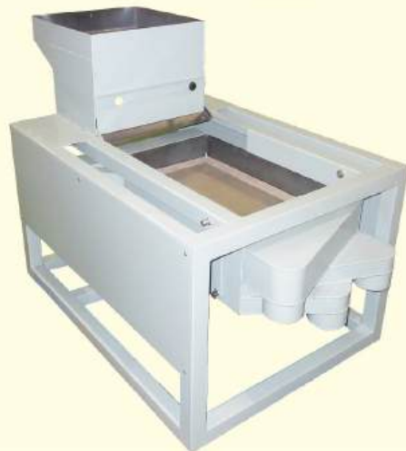
振動ふるい分別装置

最適な保護方法を検討するため、INPIT 鳥取県知財総合支援窓口が開催している知財・ビジネス共同相談会に参加しました。弁理士から、形状や構造に特徴があり、差別化が可能であることから、「意匠」の活用も選択肢であるとの助言を受けました。これを踏まえ「意匠」を活用する方針を進めることにしました。その後の専門家派遣で意匠の登録出願手続きの方法を説明し、自社で意匠登録出願をおこない、意匠権を取得されました。