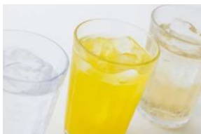
清涼飲料 ビール系飲料