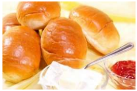
加工食品 (製パン、製麺等)