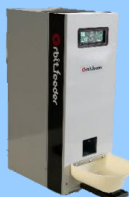
日産自動車特許許諾製品