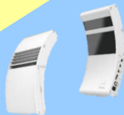
富士通特許許諾製品