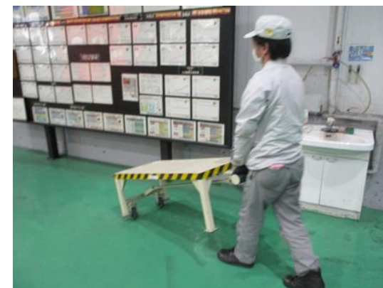
一人でスムーズな移動が可能